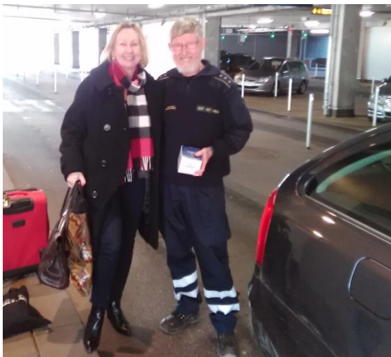
Bilde 1. Egen sjåfør