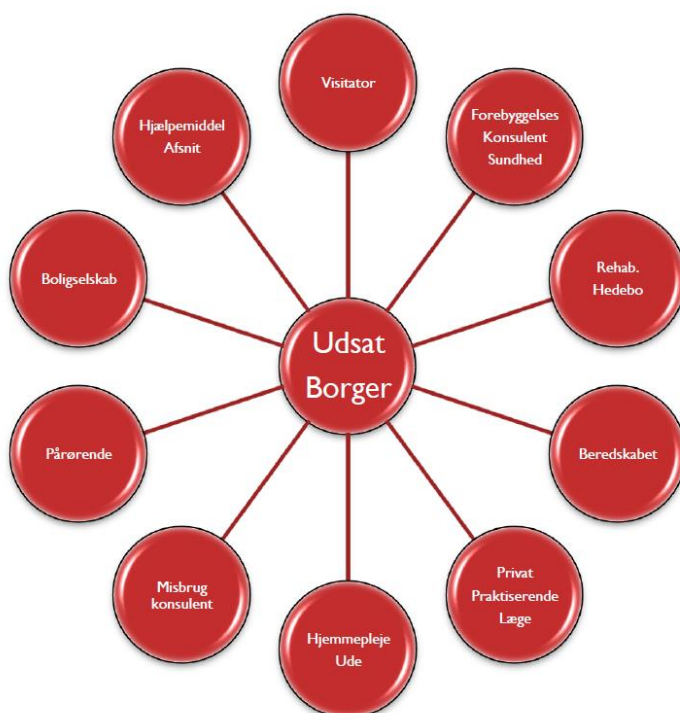
Fig.1 Mulige samarbeidspartnere

Figur 1 viser en oversikt over alle den risikoutsatte brukeren kan være i kontakt med og som kan være mulige samarbeidspartnere i arbeidet i å trygge brukeren.